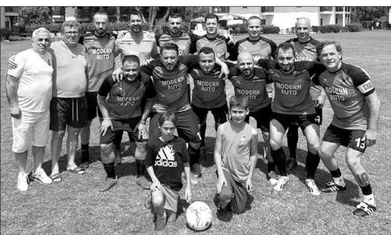
2004 Sakarya Masterlar futbol takımı Antalya'da iki maçta 11 gol attı, rakiplerine korku saldı.