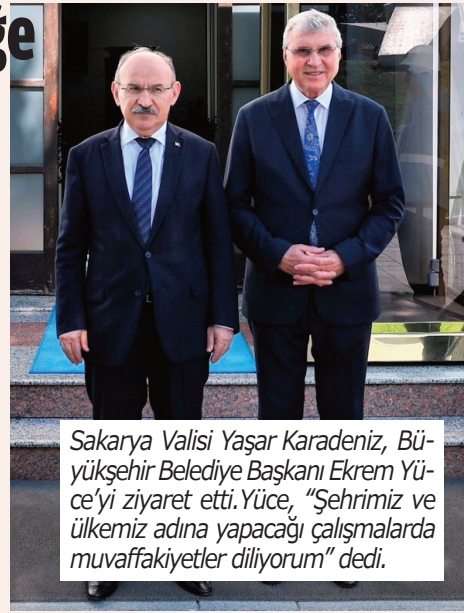
Sakarya Valisi Yaşar Karadeniz, Büyükşehir Belediye Başkanı Ekrem Yüce'yi ziyaret etti. Yüce, "Şehrimiz ve ülkemiz adına yapacağı çalışmalarda muvaffakiyetler diliyorum" dedi.

■ Karadeniz mesajında, "Atalarımızın canları pahasına vatan yaptıkları bu toprakların mirasçısı olarak bizler; milletimizin bağımsızlığı ve refahı için var gücümüzle çalışarak geleceğe daima umutla bakıyor ve sarsılmaz bir güvenle hiç durmadan hep birlikte yolumuza devam ediyoruz" ifadelerini kullandı. ► 7'de